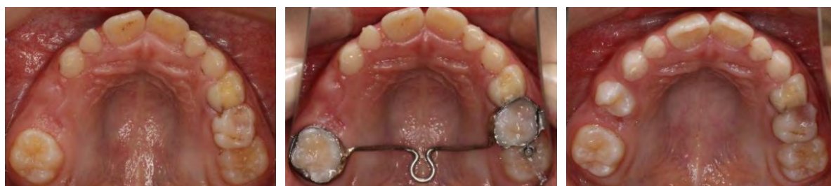
a) 矫治前上颌殆面像