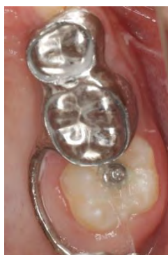
图3 Halterman 矫治器矫治左侧上颌第一恒磨牙近中异位萌出