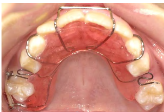
图5 活动双曲纵簧+远中弹性牵引矫治上颌第一恒磨牙异位萌出