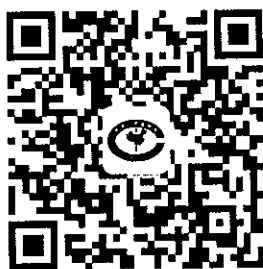
中华口腔医学会微信公众号

关注微信“中华口腔医学会”公众号，无论是否会员，进入公众号的“会员天地”，再进入“学术会议报名”，选择“儿童口腔医学临床实用技术培训班（广州）”，然后填写信息完成注册缴费。