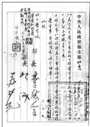
图2 卫生部批复北京大学同意将牙医学系改称口腔医学系 (1950年7月)