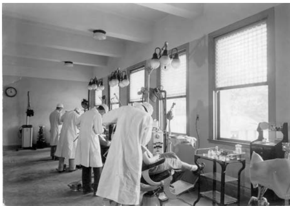
图6 六十年代的医疗环境