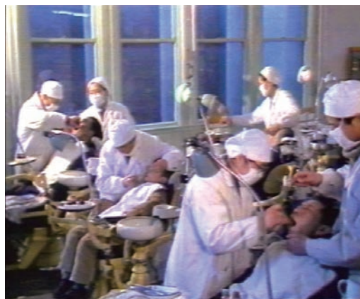
图7 八十年代的医疗环境