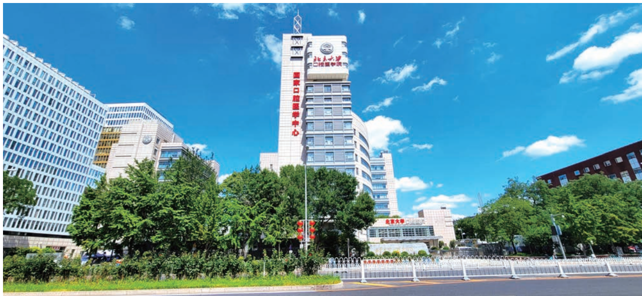
图10 砥砺前行中的北京大学口腔医学院

在中国共产党的领导下，如今的北京大学口腔医（学）院已成为医疗、教学、科研、预防四位一体的大型口腔医学院，是目前国际上口腔专科医疗服务规模最大的口腔医院，成为我国口腔医学对外交流的重要窗口。建院80年来，北京大学口腔医学院不但赢得了国内外知名的学术地位，培养了大批口腔医学人才，且形成了极具特色的医院文化。“厚德尚学、精医济世”的院将激励北大口腔学人开拓进取、追求卓越、再创辉煌。