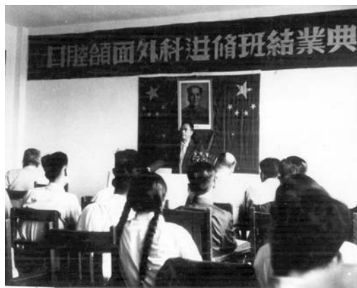
图5 苏联专家来举办卫生部高等师资进修班

1958年，上级将北京医学院附属平安医院划归口腔系管理。作为培养口腔系学生临床教学的综合医院，口腔专业与综合医院的结合在国内是一个创举。一批口腔专业毕业生分配到平安医院担任起口