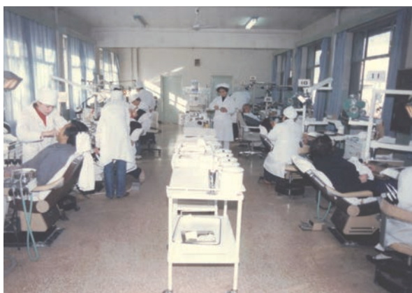
图8 九十年代的医疗环境