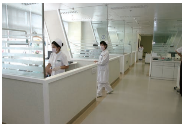
图9 新大楼现代化的医疗环境