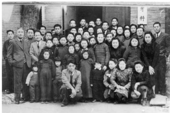
图1 1947年春节前 牙医学系牙科诊所全体师生及部分家属合影

1950年，卫生部、教育部相继批复北京大学，同意将牙医学系更名为口腔医学系（图2-3），这在全国尚属首次。随后我国口腔医学的学科范围扩大，学科发展加速。同时，为了适应社会需要，北大开始扩大招生，学制缩短为5年。