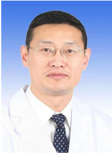
王万春 青岛大学附属青岛市口腔医院

青岛大学附属青岛市口腔医院院长，主任医师 教授 博士生导师。中华口腔医学会常务理事、中国康复学会口腔预防与康复专业委员会副主委、中华口腔医学会口腔预防专委会和口腔中西医结合专委会常委、国际牙医师学院院士。创建国内第一家口腔健康教育基地和口腔医学博物馆，入选第九届世界健康大会优秀案例。主持国家自然科学基金面上项目 1 项，承担省市级课题 7 项，发表论文 50 余篇，获得省、市科技成果奖 9 项。