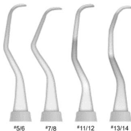
图1 常用的4支Gracey刮治器