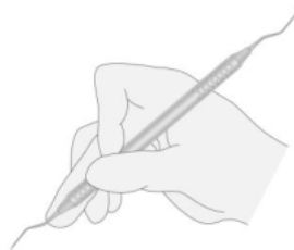
图6改良握笔式握持手用器械

采用改良握笔式。将刮治器的颈部紧贴中指腹，食指弯曲位于中指上方，握持器械柄部，拇指腹紧贴柄的另一侧，拇指、食指、中指三指构成一个三角形力点，利于稳定握持和发力，如图6。