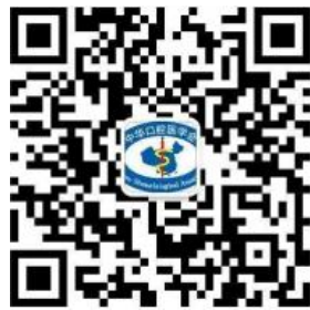
中华口腔医学会微信公众号