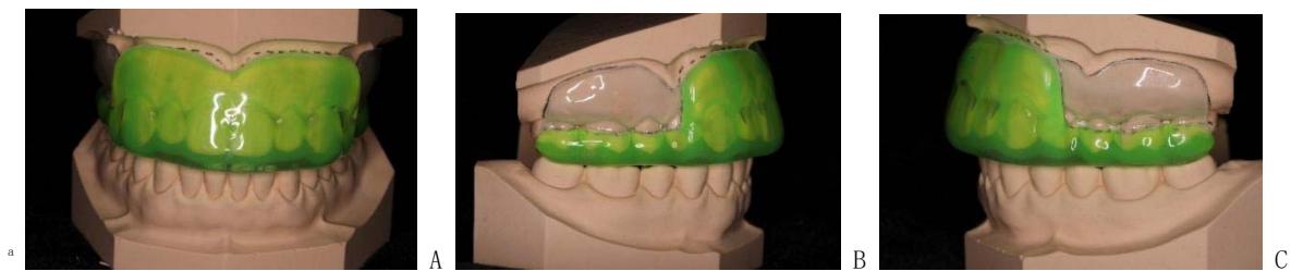
图3 热压型标准运动防护牙托完成图（A 正面观 B 右侧面观 C 左侧面观）

防护牙托应具备良好的口内适配性和固位力，在冲击力作用下抗脱位，且不影响运动员说话沟通[31]；佩戴后舒适且不引起软组织刺激或溃疡[32]。